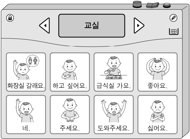
[그림] AAC 기기

유 교사: 선생님, 오늘 박 터트리기 활동 너무 재밌었죠? 그런데 박이 잘 안 터지던데 다음에는 어떻게 하면 좋을까요? 김 교사: ㉢ 약한 힘으로도 잘 터질 수 있도록 박에 틈을 내주면 되겠네요. 유 교사: 좋은 생각이네요. 김 교사: 그런데 오늘 ㉣ 아이들이 민우가 AAC 기기를 사용하지 않을 때는 꺼 두어도 된다고 말하면서 자꾸 끄더라고요. 민우랑 이야기하려면 늘 켜 뒀야 하는 것을 몰라서 그러는 것 같아요. 유 교사: 그렇군요. 지난번에 급식실에 갈 때 저도 AAC 기기를 깜빡하고 두고 갔어요. 아무래도 다함께 AAC 기기 사용 규칙을 만들어 보아야겠어요.